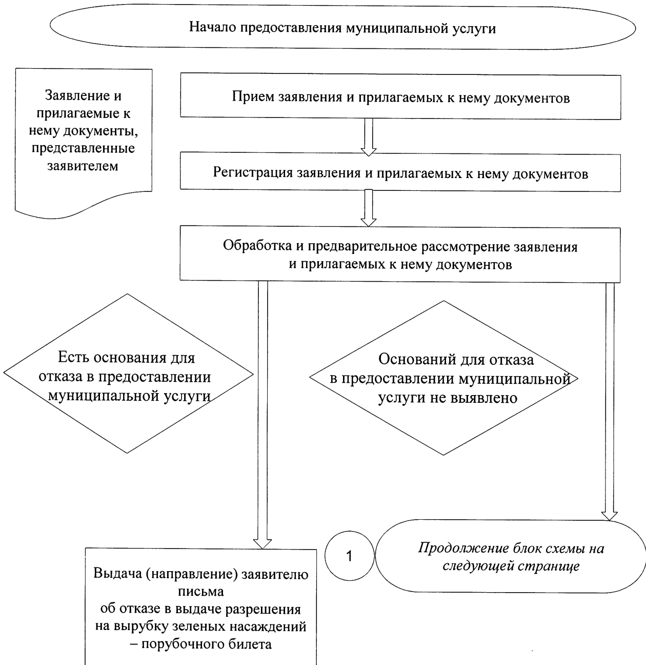
Блок-схема выдачи разрешения на вырубку зеленых насаждений – порубочного билета